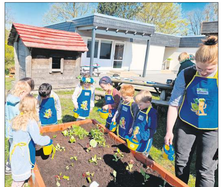
Die Kinder waren mit Feuereifer bei der Sache.

Von Hochbeet und Erde, über Setzlinge bis zu Schürzen, Gießkannen und altersgerecht aufbereitetes Lernmaterial. Da man im Vorfeld nicht weiß, welche Setzlinge und Samen von der Edeka-Stiftung kommen, hat die Kita-Leitung die Wünsche der Kinder auf-