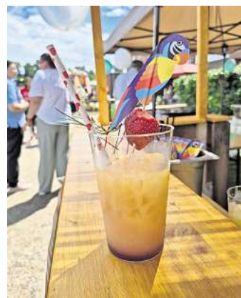
Heiß begehrt an einem heißen Sommerfest-Tag waren die gut gekühlten und liebevoll angeordneten Cocktails.

und auf jede Einzelne, der an dem Erfolg beteiligt war und ist. Ohne diese Unterstützung hätte es diese Erfolgsgeschichte nicht geben können und wir stünden nicht so gut da, wie es heute der Fall ist“. Er geht mit einem kleinen, weinenden Auge, aber auch mit der Gewissheit, den Kontakt zu der Einrichtung und auch zur Sozialstation mit Standort in Mellendorf nicht ganz zu verlieren.