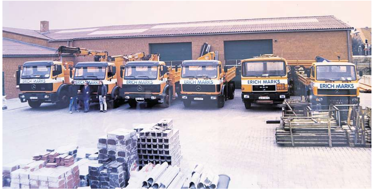
Ohne LKW geht es nicht. Ein Foto des Fuhrparks aus dem Jahr 1989.