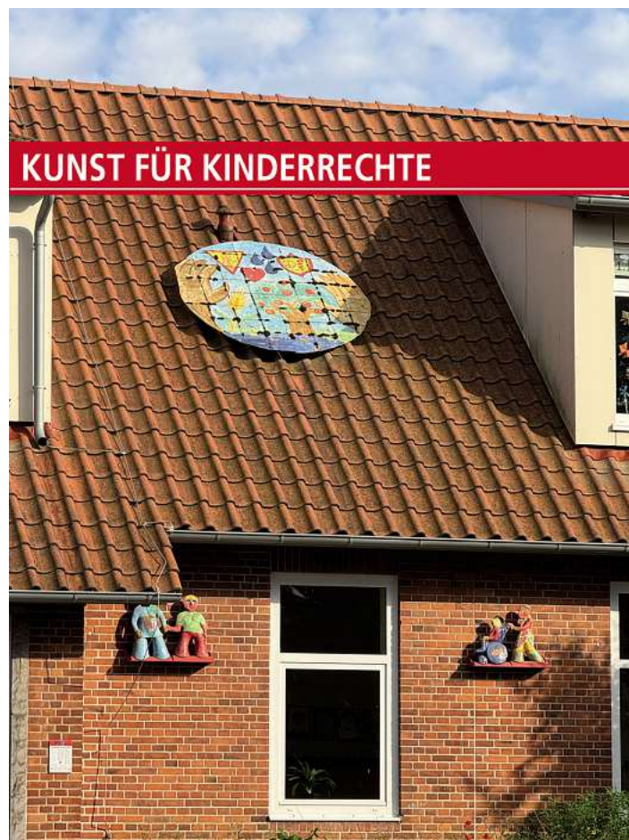
Kinderrechtskunst in Elze.