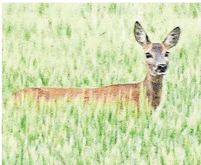
Rehe im Feld – stets ein hübscher Anblick.

... lebt schon seit über 600.000 Jahren in Europa – und besonders gern auch in den Wedemärker