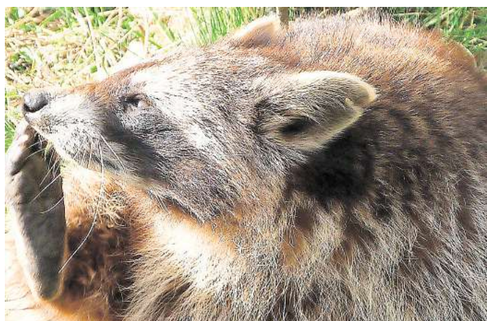
Der Waschbär dringt mittlerweile bis in die Städte vor.

und Schüler entstanden, schmückten den Dachfirst und auf der Dachfläche ist ein großes rundes Bild montiert. Dieses ist noch an seinem Platz. Das Bild haben die Kinder „Die Schutzblase“ genannt, weil es alles enthält, was ihnen für eine sichere Zukunft schützenswert erscheint. Die Ideen der Kinder: Gesundheit, ohne Not in Geborgenheit leben und Schutz vor Gewalt und Ausbeutung.