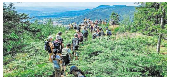
Ein tolles Erlebnis - das Zeltlager der evangelischen Jugend Bissendorf.

Er hofft, dass er einen Verlag findet, der das Buch veröffentlicht. Seine beiden bisherigen Werke sind im Selbstverlag über ePubli erschienen und im Buchhandel sowie online als Print on Demand erhältlich.