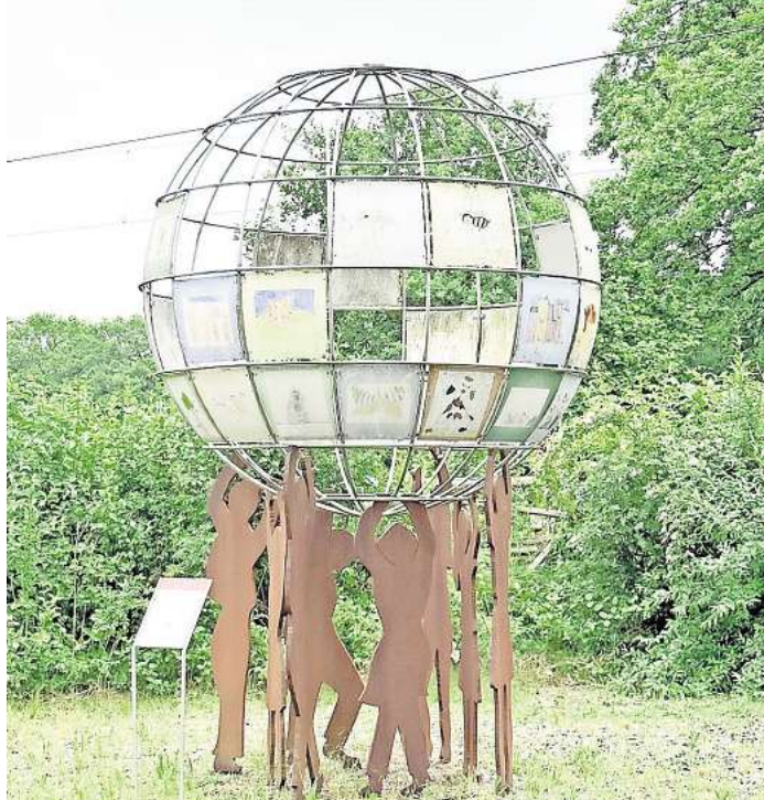
Etwas versteckt an der Bahn kommt man zum Wennebosteler Kinderrechtskunstwerk.