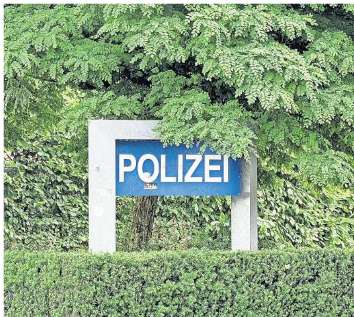
An der Zufahrt zur Polizei in Mellendorf.

Die Zahl der Diebstahlsdelikte ist ebenfalls gestiegen und zwar um 23 Taten auf die Gesamtzahl von 376 Taten. Im Bereich des Wohnungseinbruchdiebstahls wurden 2025 insgesamt 32 Taten (Vorjahr 27 Taten) im Bereich des PK Mellendorf bekannt. Leider konnten nur gut 9 Prozent davon aufgeklärt werden. Gestiegen sind die Zahlen im Bereich Diebstahl an und aus Kfz um 34 Taten, das macht 76 Prozent aus. Die Gesamtzahl der Taten beträgt 79 Taten (Vorjahr 45). Diese Zahl lässt sich mit einer längeren Serie eines einzelnen Täters erklären, sagt Bastian Lückfeldt, Leiter des Kriminalermittlungsdienstes