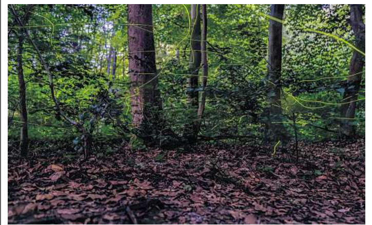
Leuchtpuren - mit Langzeitbelichtung festgehalten.

Die Zahl an Straftaten mag für die beschauliche Wedemark hoch erscheinen, doch das relativiert sich schnell, wenn man die Quote an Straftaten auf die Einwohnerzahl herunterbricht und mit anderen Kommunen vergleicht. Das Verhältnis von Einwohner/innen und Straftaten ist da eine interessante Zahl: Statistisch gesehen wurde jeder 23. Wedemärker Opfer einer Straftat. Im benachbarten Langenhagen mit rund 56.000 Einwohnern und einer Zahl an Straftaten von 5.717 war es mehr als jede/r Zehnte! Und teilt man die Zahl der Bevölkerung (rund 1,2 Millionen) durch die registrierten Straftaten in der Gesamtregion Hannover (103.478 Taten), so schneidet die Wedemark immer noch besonders gut ab – denn statistisch entfällt auf jede zwölfte Person in der Region eine Straftat.