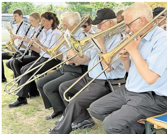
Der Musikzug der Freiwilligen Feuerwehr begleitete das Fest.