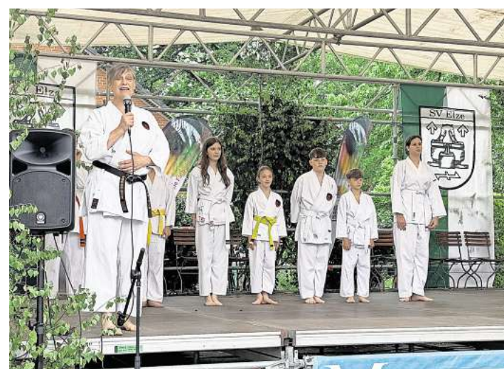
Die Karate-Kids von Blau Gelb Elze zeigten ihr Können auf der kleinen Bühne.