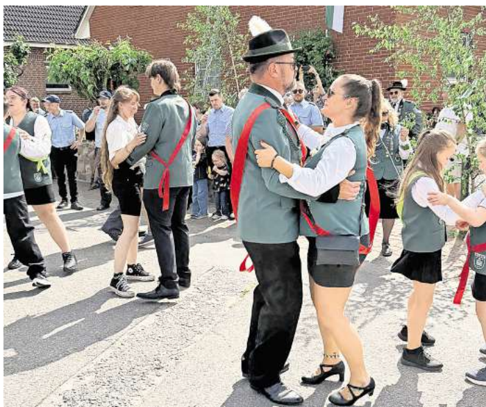
Ehrentanz der Majestäten.

Tombola, Waffeln, Kinderschminken, Gebrilltes und Kaffeetafel kamen genauso gut an wie die Vorführungen von Blau-Gelb-Elze auf der kleinen Bühne. Das Elzer Schützenfest in dieser Form wusste die Bevölkerung anzuziehen.