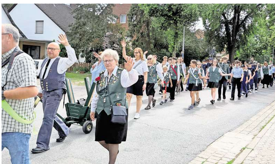
Ausmarsch entlang der Wasserwerkstraße.

Doch dafür war das „Frühstück“ im Saal am Sonntagmittag mit fast 100 Gästen bestens besucht. Die Gäste wollten schon fast den Saal verlassen, um das Platzkonzert der Feuerwehr zu genießen – da machte wieder ein