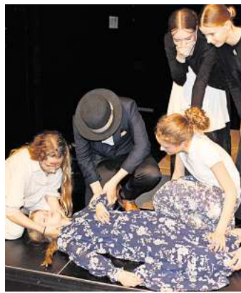
Frankenstein - interpretiert von der Theater AG des Gymnasiums.

Die Siebtklässlerin Amei mag vor allem die Atmosphäre rund ums Theater: „Die Aufregung