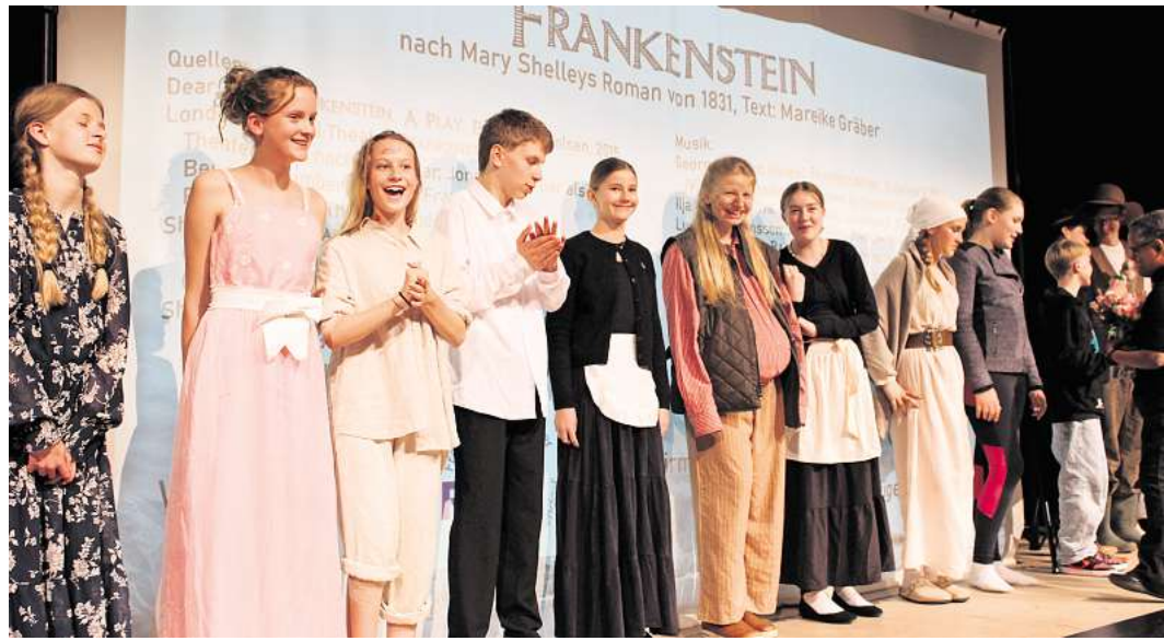
Viel Applaus für die jungen Darstellerinnen und Darsteller.