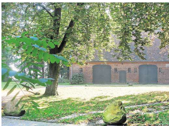
Vor der Elzer Pfarrscheune unter hohen Bäumen findet der Gottesdienst statt.

ELZE. Vor 25 Jahren, zum 1. Januar 2001, wurde der evangelisch-lutherische Kirchenkreis Burgwedel-Langenhagen durch den Zusammenschluss des damaligen Kirchenkreises Burgwedel mit Teilen des Kirchenkreises Hannover-Nord gebildet. 18 evangelische Kirchengemeinden in den Regionen Burgwedel, Isernhagen, Langenhagen und Wedemark gehören dazu – und feiern in diesem Jahr das 25-jährige Bestehen ihres Kirchenkreises.