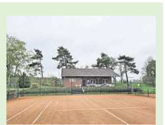
Die Tennisanlage in Elze.