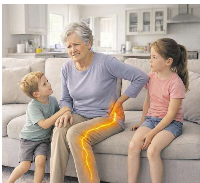
Der Ischiasnerv kann bis zu 40.000 Nervenfasern enthalten, die Informationen zwischen dem Gehirn und den Beinen transportieren.

fen meist Entzündungen. Anders die Schmerzmittel Restaxil, die speziell zur Behandlung von Nervenschmerzen, wie z. B. bei einer Ischialgie, entwickelt wurden. So wird etwa der Arzneistoff Iris versicolor in Restaxil laut Arzneimittelbild vor allem bei Ischialgien mit ziehenden, reißenden und brennenden Schmerzen