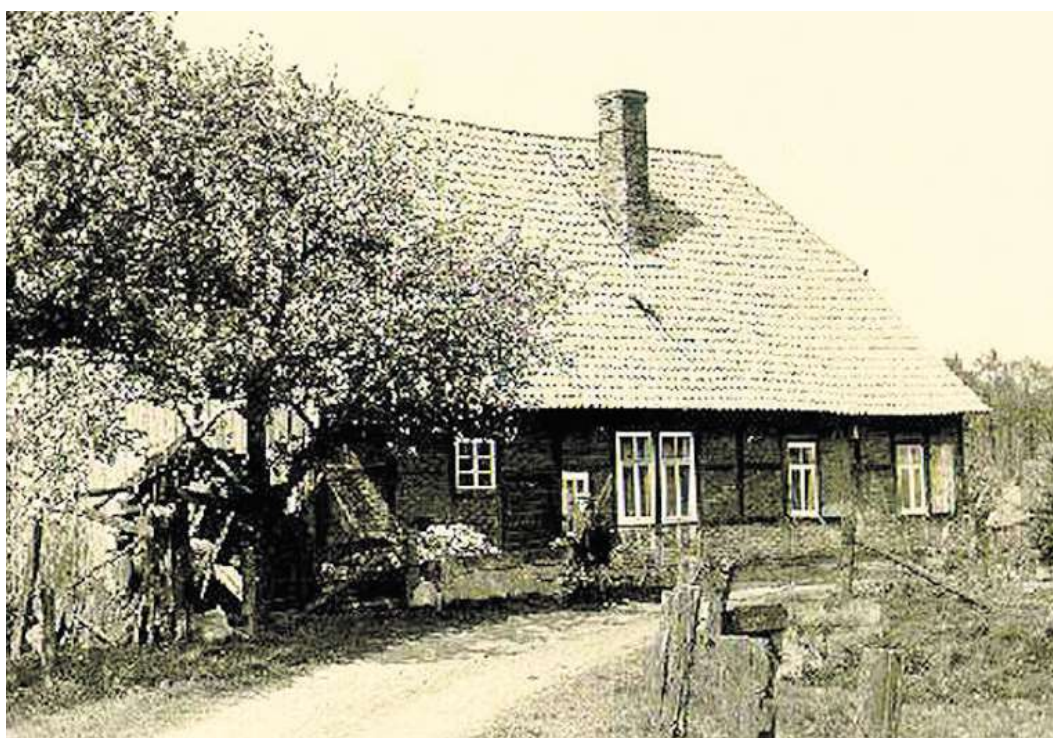
Die alte Viehbruchsmühle in den 50er Jahren.

Der Niedergang begann mit einem Zeitungsartikel, der es eigentlich gut meinte mit der