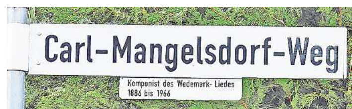
Ein Weg dort, wo er gewirkt hat.