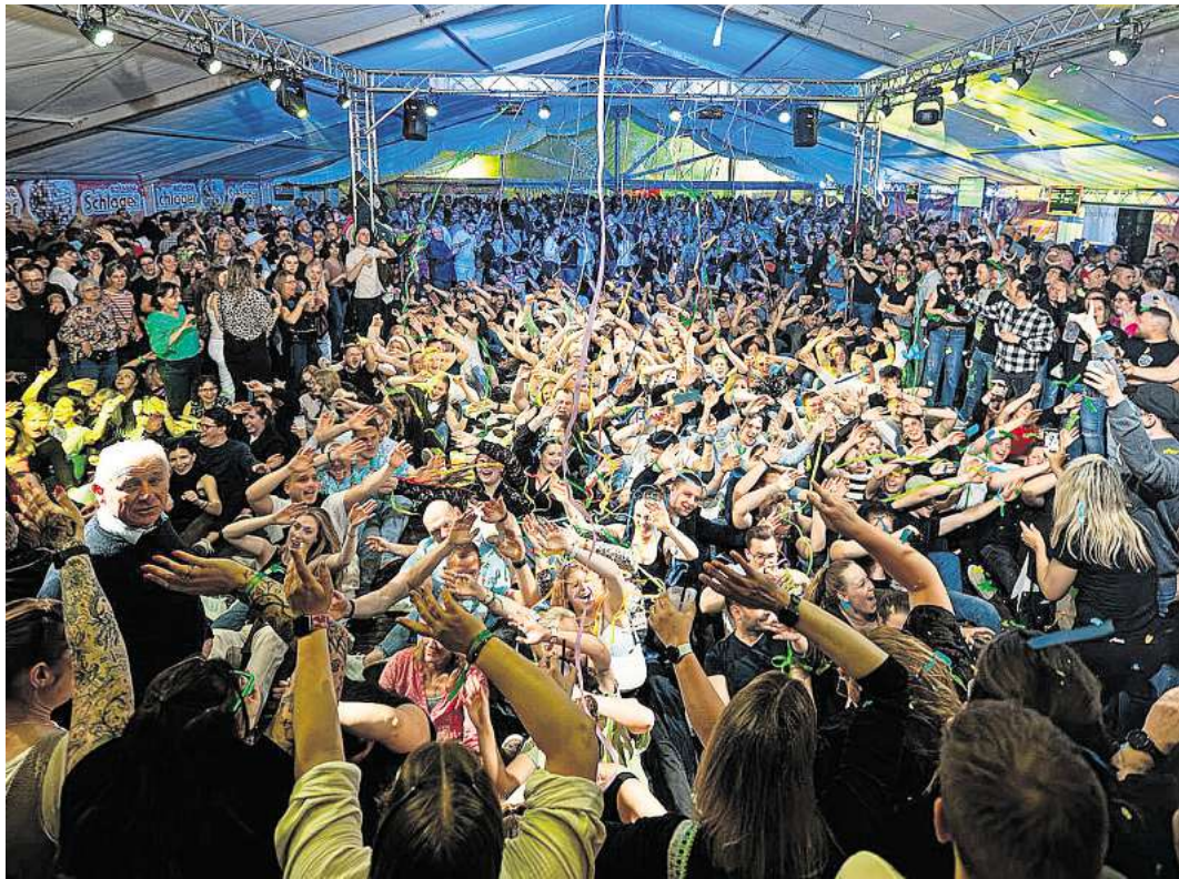
Beste Partystimmung im Festzelt.

ty 1998 als eine Gruppe des Scheffer Clubs des Brelinger Schützenvereins die Idee aus der Taufe hob: Eine Party mit Schlagermusik veranstalten. Viele Jahre war DJ Karsten Brandt, bekannt auch als „der Bäcker“ derjenige, der am Plattenteller stand und aufgelegt hat. Schnell entwickelte sie das Event immer mehr zum Publikumsmagneten, ein Sicherheitsdienst wurde mit einbezogen und mittlerweile ist auch durch den Verkauf der Eintrittskarten ausschließlich im Vorverkauf die Zahl der Gäste auf eben die rund 2.000 beschränkt worden. Und weil die Veranstaltung längst einerseits einen Kultstatus erreicht hat, andererseits aber auch ein hohes Maß an Vorbereitungsarbeit und einen nicht weniger hohen Anspruch an die Durchführung der Nacht mit sich bringt, ist seit einigen Jahren die KS Veranstaltungskonzepte mit Sitz in Schwarmstedt mit im Boot. Ganz ohne Zwischenfall ging die Nacht dann aber doch nicht ab: Weit nach Mitternacht, gegen 3.30 Uhr hat es dann trotz aller Sicherheitsvorkehrungen eine Rangelei zwischen zwei Partygästen und einem Security-Mann gegeben, bei der eine 48-jährige Frau einen Schlag ins Gesicht bekommen hat. Sie wurde vorsorglich vom Rettungsdienst in ein Krankenhaus gebracht.