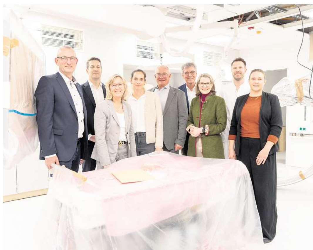
Das neue Herzkatheterlabor wurde am Montag symbolisch eingeweiht.

GROßBURGWEDEL. Mit der Medizinstrategie 2030 definiert das Klinikum Region Hannover (KRH) neue, abgestufte Versorgungsrollen innerhalb seines Kliniknetzwerks. Ein zentraler Baustein dieser Strategie ist die Weiterentwicklung des KRH Klinikums Großburgwedel zu einem Schwerpunktversorger. Durch die Zusammenführung von Lehrte und Großburgwedel entsteht hier ein neuer Schwerpunktversorger, der gezielt mit weiteren neuen Versorgungsangeboten ergänzt wird. Dabei soll das erweiterte und spezialisierte Versorgungsangebot für die Patientinnen und Patienten nicht erst im Neubau zur Verfügung stehen. Deshalb investiert das KRH bereits jetzt gezielt in den Ausbau und die Stärkung des Standorts Großburgwedel.