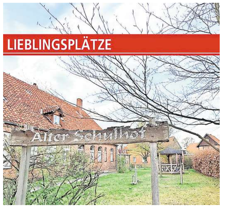
Der alte Schulhof.