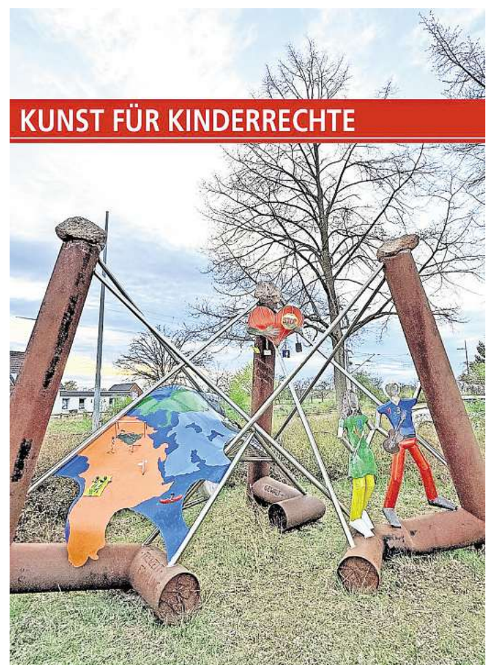
Am Bahnhof Bennemühlen.

worden. Im Gebäude daneben – erst Schule, später Post – sind heute VHS und DRK beheimatet. Es gibt viele gute Gründe, sich auf dem Gelände aufzuhalten und darum ist es in Elze auch ein „Lieblingsplatz“.