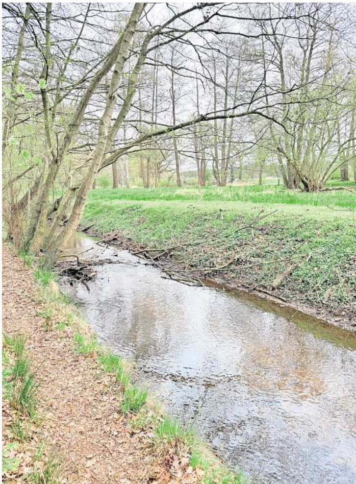
Die Jürse hinter Abbensen.

In Negenborn, wo noch die Heidebeke in die Jürse mündet, streift der Bach zum ersten Mal bewohntes Gebiet und fließt dann durch Wald und Feld Richtung Abbensen. Die Ochsenbeke mündet dort in die Jürse. Eine Abbenser Straße weist darauf hin, dass es an der Jürse einst Wassermühlen gab, von denen allerdings keine erhalten ist. Die Bezeichnung der Straße „Obermühle“ meint nämlich nicht die Windmühle, die direkt am Weg liegt. Die Obermühle war eine Wassermühle rund 500 Meter