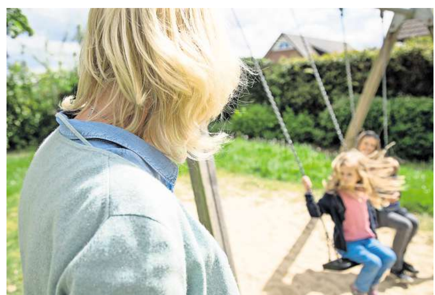
Anspruch auf Erziehungsrente: Geschiedene mit Kindern erhalten nach dem Tod des Ex-Partners eine besondere Hinterbliebenenrente zur Sicherung des Unterhalts.

Gezahlt wird die Erziehungsrente aus der eigenen Versicherung. Voraussetzung für die Leistung ist, dass die überlebende Person bis zum Tod des früheren Partners mindestens fünf Jahre lang Beiträge in die gesetzliche Rentenversicherung eingezahlt hat. Die Ehe muss außerdem nach dem 30. Juni 1977 geschieden worden sein, der überlebende Partner darf danach nicht wieder geheiratet haben. Die Erziehungsrente wird sowohl gezahlt, wenn hinterbliebene Ex-Partner eigene und Kinder des früheren Partners erziehen als auch, wenn es sich um Stief- oder Pflegekinder handelt. Betroffene beantragen die Erziehungsrente beim zuständigen Rentenversicherungsträger. Ein Anspruch besteht bis zum 18. Geburtstag eines Kindes. Hat das Kind eine Behinderung, entfällt die Altersgrenze.