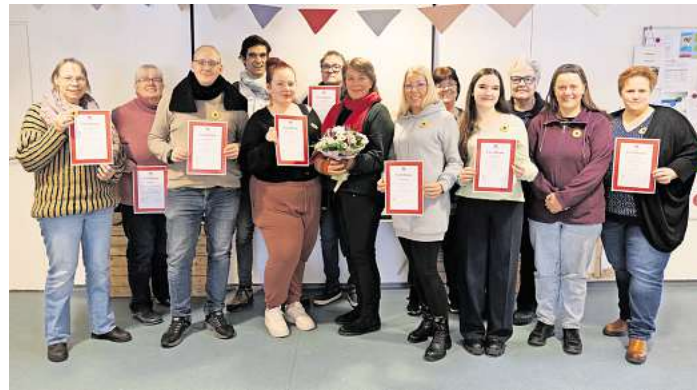
Nach dem erfolgreichen Abschluss der Marte-Meo-Ausbildung halten die Mitarbeitenden ihre Zertifikate in den Händen.