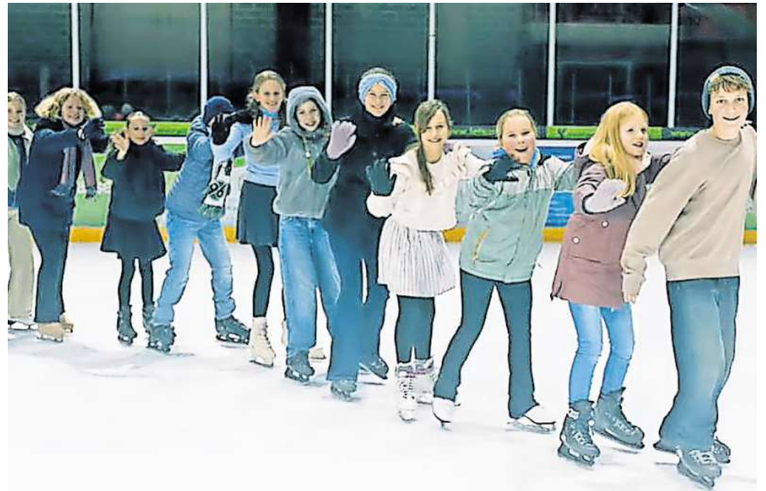
Hand in Hand, oder auch mal hintereinander: Die Sängerinnen und Sänger des Chors demonstrieren ihre gute Gemeinschaft.

Die Tonaufnahmen hätten die jungen Sängerinnen und Sänger