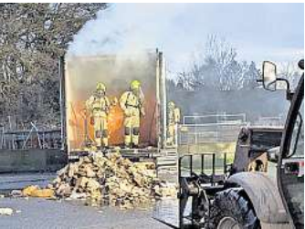
Zahlreiche Feuerwehrleute waren bei dem LKW-Brand in Gailhof im Einsatz.

GAILHOF (R/BS). Am Mittwoch vergangener Woche gegen 15.45 Uhr wurden die Feuerwehren Gailhof, Meitze, Mellendorf und Wennebostel zu einem LKW-Brand auf den Autohof in Gailhof alarmiert. Beim Eintreffen der ersten Einsatzkräfte stand die Zugmaschine des Kühltransporters bereits in Vollbrand. Obwohl die Feuerwehr sofort mit den Löschmaßnahmen begann, war ein Ausbreiten des Feuers auf den Auflieger nicht mehr zu verhindern. Der LKW war voll beladen mit tiefgefrorenen Backwaren. Mit Hilfe eines Teleskopladers und im späteren Verlauf per Hand musste der LKW entladen werden. Hierfür würde im weiteren Verlauf des Einsatzes die Ortsfeuerwehr Elze mit weiteren Atemschutzgeräteträgern nachalarmiert. Gegen 19 Uhr könnten die letzten Einsatzkräfte die Einsatzstelle verlassen. Die Feuerwehr Wedemark war mit 45 Einsatzkräften und neun Fahrzeugen vor Ort.