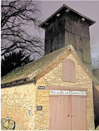
Das Elzer Ritual Turmblasen findet am historischen Spritzenhaus mit dem hölzernen Schlauchturm dahinter statt.