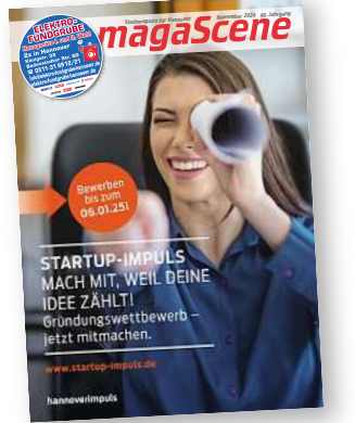
Stadtmagazin für Hannover magaScene

Diese Enge hier. Wenn der Laden pickelvoll ist, die Leute Schulter an Schulter stehen und bis an die Band gedrückt werden, lädt sich der Raum auf eine magische Art auf. Dann wird es körperlich und emotional. Ich hatte hier schon Gäste, die völlig durchgedreht sind, die kommen mit Alltagsmüde rein und stürzen verschwitzt und glückselig wieder raus. Das schafft nur dieses Live-musik-Ding.