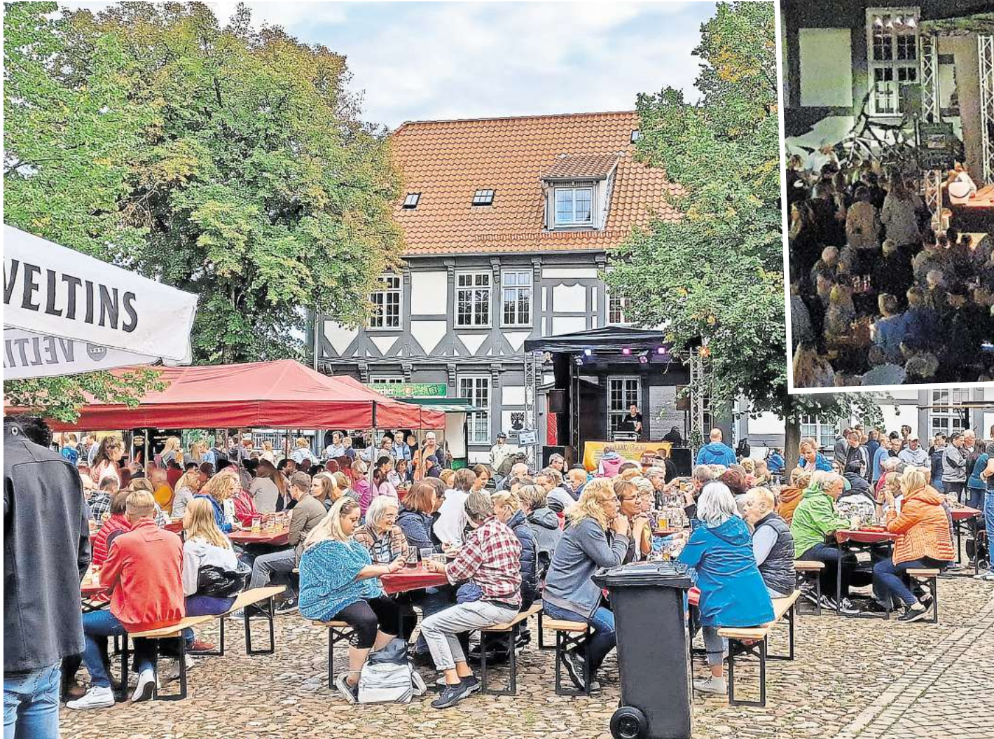
Am kommenden Samstag wird der Amtshof in Bissendorf zum Treffpunkt für Bierfreundinnen und -freunde.