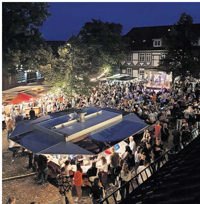
Stimmungsvoll wird es werden, wenn der Abend kommt und die Beleuchtung den Amtshof in ein besonderes Licht taucht.

Hier wird es darüber hinaus auch Mischgetränke wie Aperol