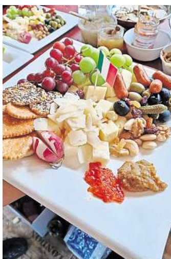
Auch für das kulinarische Wohl wird gesorgt, unter anderem mit Käseplatten.

hafte Crepes-Spezialitäten an sowie Käseteller und Laugen Brezeln, abgerundet wird das Angebot mit leckerer Pizza. Es wird also an diesem Tag für alles gesorgt, damit das Bierfest auch in diesem Jahr wieder ein tolles Angebot für das Publikum sein kann.