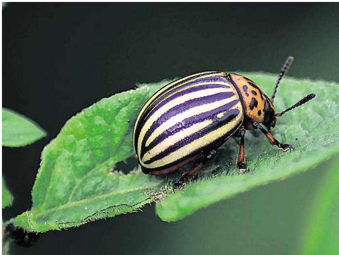
Nicht nur an Kartoffelpflanzen richtet der nach ihnen benannte Käfer Schaden an.

Gartenlaubkäfer: Während sich der metallisch-grüne Käfer mit braunen Flügeln von Blättern und Blüten ernährt, bevorzugt sein Nachwuchs Graswurzeln und hinterlässt kahle Stellen im Rasen. Die Engerlinge lassen sich mit Nematoden bekämpfen, ihre Eltern sind Beute von Vögeln und Fledermäusen.