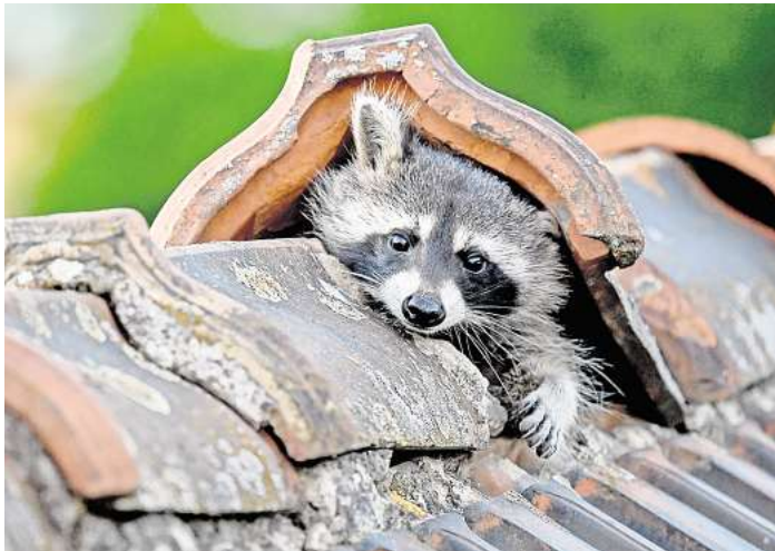
Unerwünschter Nachbar: Die steigende Präsenz von Waschbären in Wohngebieten sorgt zunehmend für Unmut bei Anwohnern.

Es rumpelt auf dem Dachboden? Hat dort ein Waschbär Unterschlupf gesucht, rät die Tierchutzorganisation «Vier Pfoten» zu prüfen, wie das Tier dorthin gelangen konnte. Meist klettern Waschbären über Regenfallrohre oder über Bäume mit überhängenden Ästen aufs Dach und gelangen so ins Haus. Hier kann man ansetzen - und dem Waschbären künftig Wege und Zugänge versperren. Der Naturschutzbund (Nabu) rät, Bäume und Sträucher, die an oder über das Dach reichen, großzügig zurückzuschneiden. Regenrohre kann man mit einer glatten Blechmanschette verkleiden, sodass die Tiere daran nicht mehr hochklettern können. Ein starkes Metallgitter auf dem Schornstein etwa verwehrt ihnen den Zutritt zum Haus, auch andere Zugänge sollte man mit soliden Baumaterialien verschließen. Noch ein Tipp, damit der Waschbär nicht auch die Küche entdeckt und plündert: nachts die Katzenklappe verriegeln.