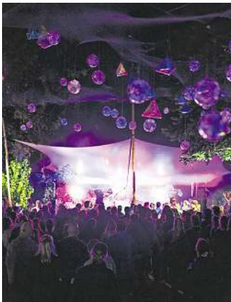
Das SNNTG Festival geht vom 26. bis zum 28. Juli.

Viele weitere, spannende Neuigkeiten aus der lokalen Kulturszene finden Sie in der aktuellen Ausgabe unseres Partnermediums magaScene, monatlich frisch gedruckt und kostenlos an über 500 Ausgeposteten in Hannover oder online auf www.magaScene.de inklusive Download-Möglichkeit.