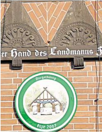
Wer kann diesen Bildausschnitt in Elze zuordnen?

ELZE. Damit alle in Zukunft mit noch offeneren Augen durchs Dorf laufen, veröffentlicht der Verein Dorfbild Elze jeden Mo-nat ein Suchbild mit einem Detail eines Hauses oder einer Hofan-lage. Dieses Merkmal ist von der Straße aus zu erkennen, sodass das jeweilige Grundstück nicht betreten werden muss. Das Suchbild hängt auch im Schaukasten des Vereins Dorf-bild Elze,Wasserwerkstraße 21/21a. Die richtige Lösung kann bis zum Monatsende per E-Mail an ehtheilmann@dorfbild-elze.de geschickt werden oder in den Briefkasten von Wasser-