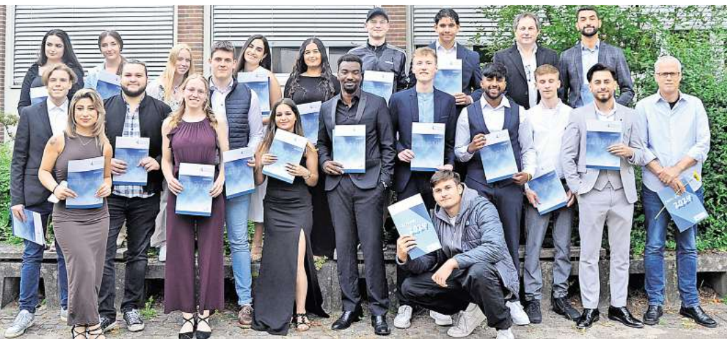
Die erfolgreichen Absolventen der Fachoberschulen Technik und Wirtschaft der BBS Burgdorf.

und Bedrohungen ein und betonte die Bedeutung eines jeden Einzelnen, sich für Toleranz, Vielfalt und Internationalität einzusetzen. „Mit diesem Schulabschluss stehen Ihnen viele Wege offen, die Arbeitsmarktchancen sind gut und Sie haben hier an der Schule das Rüstzeug für die weitere berufliche Laufbahn erhalten“, so Jürgensen. Er beton-