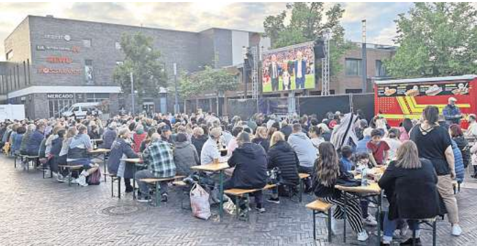
EM-Eröffnungsspiel der Deutschen gegen Schottland: Die Stimmung beim Public Viewing auf dem Marktplatz war großartig.

der Interessengemeinschaft der Händler im Bestandscenter, die tatkräftig durch das Eventmanagement der Madsack Medien Hannover unterstützt werden. Der Eintritt ist kostenlos. Für das leibliche Wohl sorgen Catering-Angebote aus den Reihen der CCL-Händler. Das Public Viewing wird auf einer zwölf Quadratmeter großen LED-Wand ausgestrahlt. Die Stadt Langenhagen stellt den Marktplatz für die drei Vorrundenspiele der deutschen Fußballnationalmannschaft zur Verfügung.