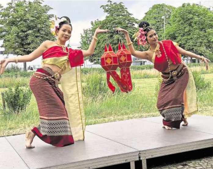
Um 12 Uhr zeigen thailändische Tempeltänzerinnen traditionelle Tänze.

schen vier Mitarbeiterinnen. Kurz nach Eröffnung ihrer ersten Praxis in Mellendorf an der Eitzer Föhre musste sie aufgrund der Corona-Entwicklung bereits wieder vorübergehend schließen: „Das war keine einfache Zeit“, erinnert sie sich. Gelernt hat sie die besondere Kunst der verschiedenen Massagen wie Hot Stone, Öl Massage oder auch Fuß Massage noch in Thailand, aber trotz der inzwischen über 20-jährigen Berufserfahrung gehören jährliche Fortbildungen bei einem Thai-Meister in den Niederlanden zu ihren regelmäßigen Terminen: