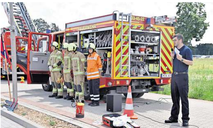
Auch das eigene Fahrzeug, die Ausrüstung und die Aktiven stellten sich vor.

ihren eigenen Nachwuchs generiert. Darüber wurde ausführlich informiert und Eintrittsformulare verteilt. Aber auch Quereinsteiger für die aktive Wehr sind in Berkhof immer willkommen.