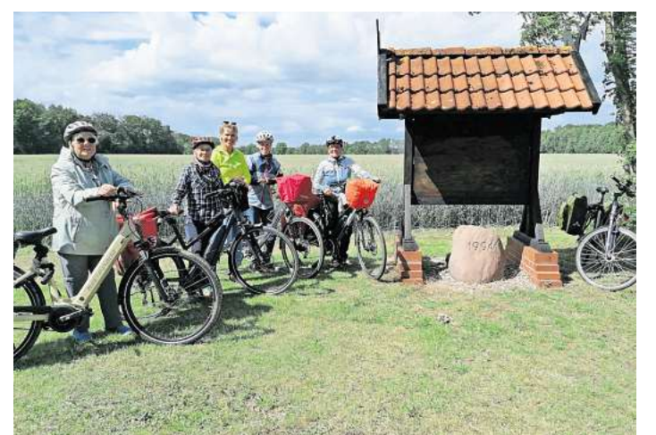
Hier wird der Radweg der Kinderrechte wieder gut ausgeschildert.

Der Zeitpunkt der Einweihung der neuen Karte ist gut gewählt. An diesem Tag findet das 24. Stunden Radrennen um den Brelinger Berg statt. Dazu versammeln sich seit Jahren die Bewohner der Dörfer Duden-Rodenbostel und Ibsingen, um den Extremsportlern zuzujubeln. Anlässlich der Karteneinweihung um 18 Uhr, ist auf dem Dreieck ein Zelt aufgebaut und für das leibliche Wohl gesorgt.