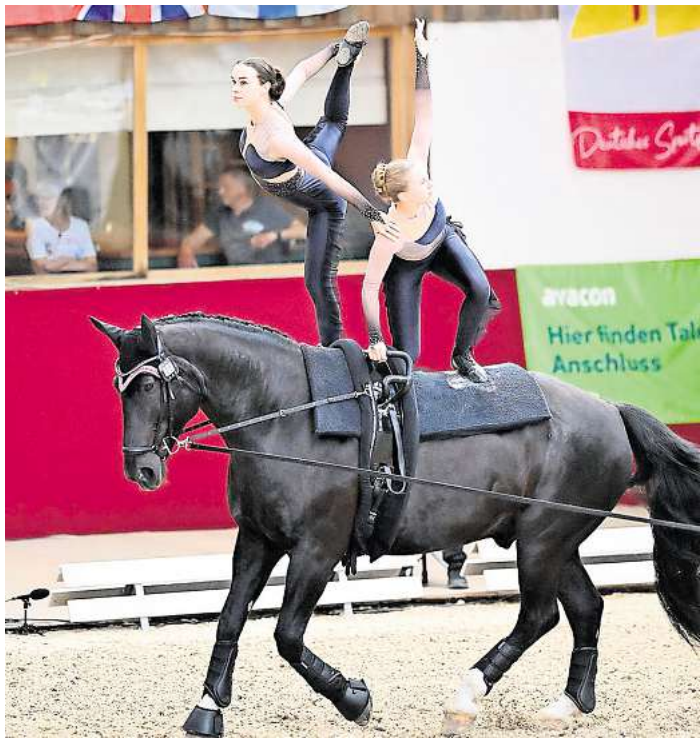
Erfolgreiche Teilnahme für die Wedemärkerinnen in Krumke.