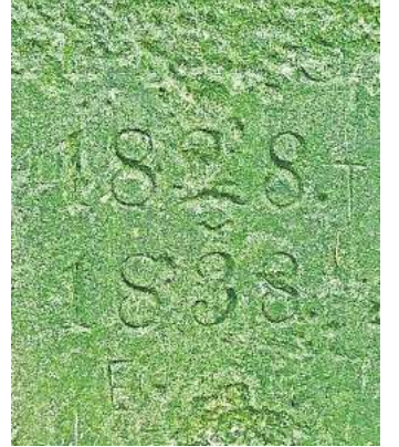
Die Stele zeigt die Jahre, in denen die Triangulation stattfand.

Dass gerade die hügelige Landschaft der Wedemark ein Teil dieses historischen Netzwerks wurde, ist kein Zufall. Für die Triangulation – also das „Vermessen durch Dreiecke“ – waren gut sichtbare Höhenzüge und markante Bauwerke von zentraler Bedeutung. Orte wie der Brelinger Berg oder der Bissendorfer