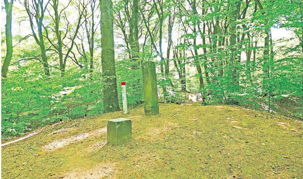
Gaußstein und Gedenkstele in der Stille der Brelinger Berge.

Einer der prominentesten dieser Vermessungspunkte ist der Gaußstein auf dem Brelinger Berg. Auf 92 Metern Höhe steht dort ein schlichter, steinerner Pfeiler mit quadratischer Deckplatte. Unspektakulär im Aussehen, von großer Bedeutung in der Geschichte der Geodäsie. Der Stein markiert einen sogenannten Hauptpunkt der Gaußschen Triangulation – ein Ort, von dem aus mit Theodoliten und mathematischer Präzision Entfernungen zu anderen Landmarken berechnet wurden. Weniger bekannt, aber nicht minder bedeutsam: Auch die St.-Michaelis-Kirche im Ort Bissendorf wurde in das Vermessungsnetz einbezogen. Der 27 Meter hohe Turm diente als trigonometrischer