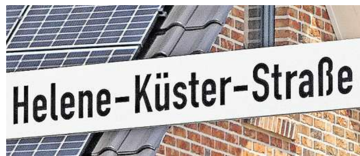
Die neue Straße im Gebiet Bäckkamp

Doch jetzt, im neuen Wohngebiet Bäckkamp, haben ein Mann und eine Frau diese Würdigung bekommen.