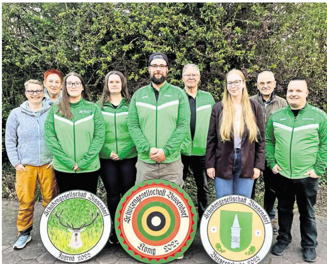
Sieger und Siegerinnen.