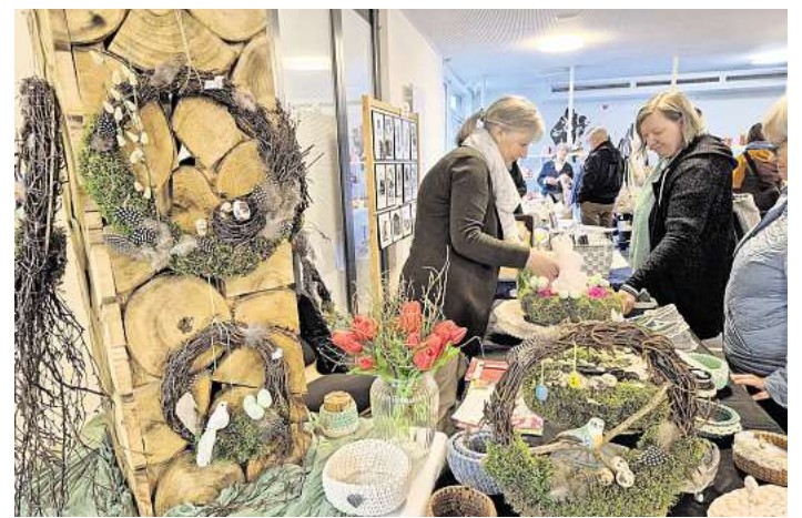
An den Ausstellerständen wurde häufig gefachsimpelt. Das gegenseitige Tipps geben gehört neben dem Angebot, handgefertigte Hobbykunst zu erwerben auch dazu.

Sie haben Pläne für die Zukunft und ermuntern auch gerne Gruppen oder Vereine, sich donnerstags während der Marktzeit von 14 bis 18 Uhr zu präsentieren. Wer Interesse hat, kann sich per Mail an den Vorsitzenden des Vereins wenden: info@dettmers-landschlachtere.de. Und am des sonnigen Markttag gab es eine freundliche Verabschiedung mit einem fröhlichen „Man sieht sich!“.