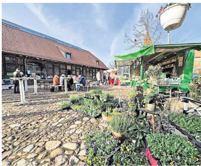
Der Landmarkt kann mit den neuen Beschickern noch stärker zum Treffpunkt werden.

BISENDORF (JO). Die üppige Blütenpracht macht gute Laune, würziger Käsegeruch wabert durch die Frühlingsluft und ein paar Schritte weiter steigt einem der unverwechselbare Duft von frisch gebackenen Crêpes in die Nase. Der Landmarkt in Bissendorf ist wieder um einige Beschicker reicher geworden und die Sorgen so für noch mehr Attraktivität des besonderen Einkaufsvergnügens. Über zehn Jahre zurück reicht die Geschichte des kleinen Marktes auf dem Amtshof in Bissendorf zurück – und in dieser Zeit ist einiges passiert. Für zahlreiche Bissendorfer hat er sich zu einem beliebten Treffpunkt entwickelt, für manch einen auch während der ungemütlicheren Jahreszeit.