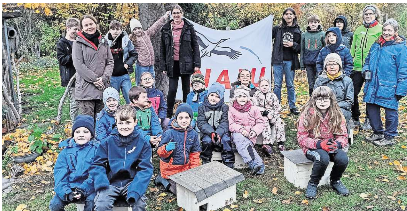
Die NAJU's haben viel über das Leben der Igel erfahren.