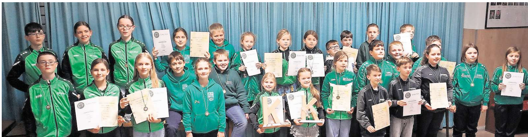
Rund 30 Kinder nahmen am Bestenschießen des Kreisschützenverbandes Wedemark-Langenhagen teil.