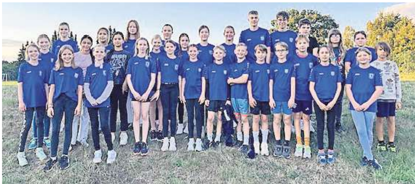
Die Gruppe nimmt regelmäßig an Wettkämpfen teil.

34 Kinder zwischen zehn und 14 Jahren trainieren mit Spaß und Ehrgeiz