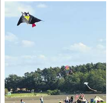
Einige der Drachen waren auffällig.

ABBENSEN. Vergangenen Sonntag hatte der Dorfverschönerungsverein Abbensen (DVV) zum jährlichen Drachenfest am Stoppelfeld „Zum Hundshop“ eingeladen. Das Wetter zeigte sich von seiner besten Seite und viele Einwohner und Gäste nutzten dies, um einen schönen Nachmittag mit kühlen Getränken, gegrillten Würstchen, Pommes oder bei Kaffee und Kuchen zu verbringen. Die Kuchen-/Tortentafel war so lang und vielfältig, dass es vielen schwerfiel, sich zu entscheiden. Da der Wind allerdings zeitweise Pause machte, war es nicht ganz leicht die Drachen fliegen zu lassen. Trotzdem schwebten viele bunte Drachen in Form von Tieren und Fabelwesen am Himmel. Mit dabei waren die „Kronis“, ein Drachenfliegerverein aus Hannover, der mit seinen auffälligen Drachen für Unterhaltung sorgte.