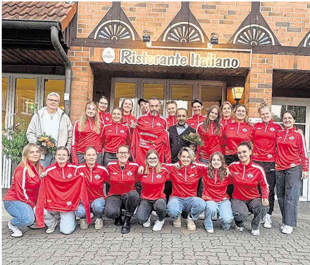
Das Ristorante Italiano unterstützt jetzt die beiden Damenmannschaft des Mellendorfer TV.

Alle Seiten betonen, dass Transparenz und Fairness im Vordergrund stehen: Das Sponsoring soll die sportliche Entwicklung der Mannschaft unterstützen und gleichzeitig die Sichtbarkeit der Sponsoren als engagierten Teil der Gemeinschaft regio-