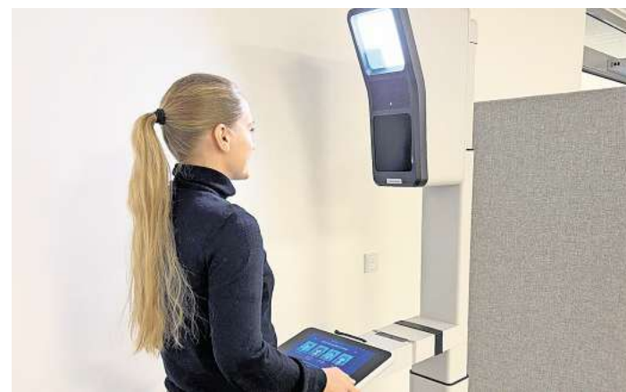
Der Weg zu externen Anbietern entfällt jetzt für ein Foto.

Um den Ablauf reibungslos zu gestalten, sollten Kundinnen und Kunden etwa zehn Minuten vor ihrem vereinbarten Termin erscheinen. Das Bild wird am Gerät erstellt und steht dem Bürgerbüro anschließend digital zur Verfügung. Die Aufnahme kostet sechs Euro. Die Kosten werden