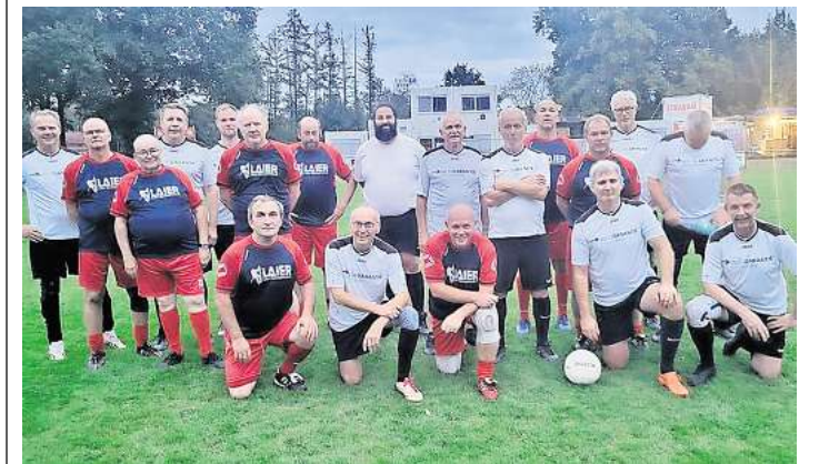
Das Freundschaftsspiel hatten einen klaren Ausgang.

wurden gemeinsam einige Würstchen vom Grill verzehrt und das Spiel bei einem Kaltgetränk analysiert. Eintracht Leinetal freut sich schon jetzt auf ein Rückspiel in Elze. Interesse und Spaß daran, auch in höherem Alter Fußball zu spielen? Einfach vorbeikommen und mitspielen - immer donnerstags ab 19 Uhr auf dem Sportplatz in Schwarmstedt oder meldet Euch per Mail an: info@eintracht-leinetal.de