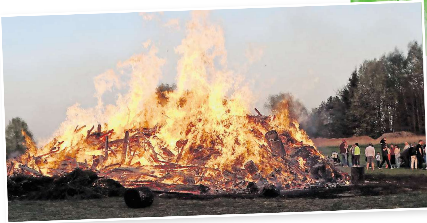
Bis heute sind die Osterfeuer beliebt, auch in der Wedemark lodern sie an den Ostertagen in fast allen Dörfern.