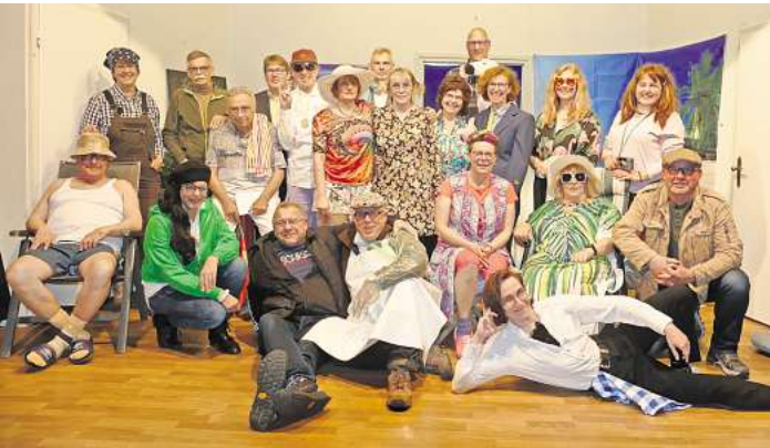
Die Theatergruppe lädt zu zwei Abenden im April ein.

Max und Anna sind ein glücklich verheiratetes Paar und freuen sich auf ihre silberne Hochzeit. Julia, Annas beste Freundin, mischt sich offen in die Überle-