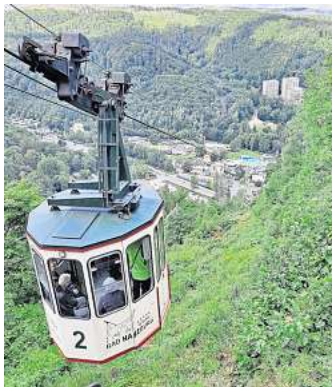
Bad Harzburg: Die Baumschwebbahn führt zum Großen Burgberg.