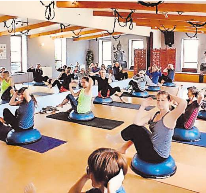
Bewegt und entspannt – durchatmen!

Work und BodyArt Moves, über FaszienTraining auf dem Spinefitter bis hin zur Yogasession im Tuch oder in den Schlingen und am Ende zum tiefenentspannten Alphazustand. Der Entspannung sind keine Grenzen gesetzt: Sauna und Naturtauchbecken, Massagen (extra buchbar) und Ruheräume, Gemütlichkeit und gesunde Kost bieten die besten Voraussetzungen, um die Seele baumeln zu lassen. Anmeldungen unter (0160) 7 75 06 57/schoene.aussicht.lindwedel@t-online.de