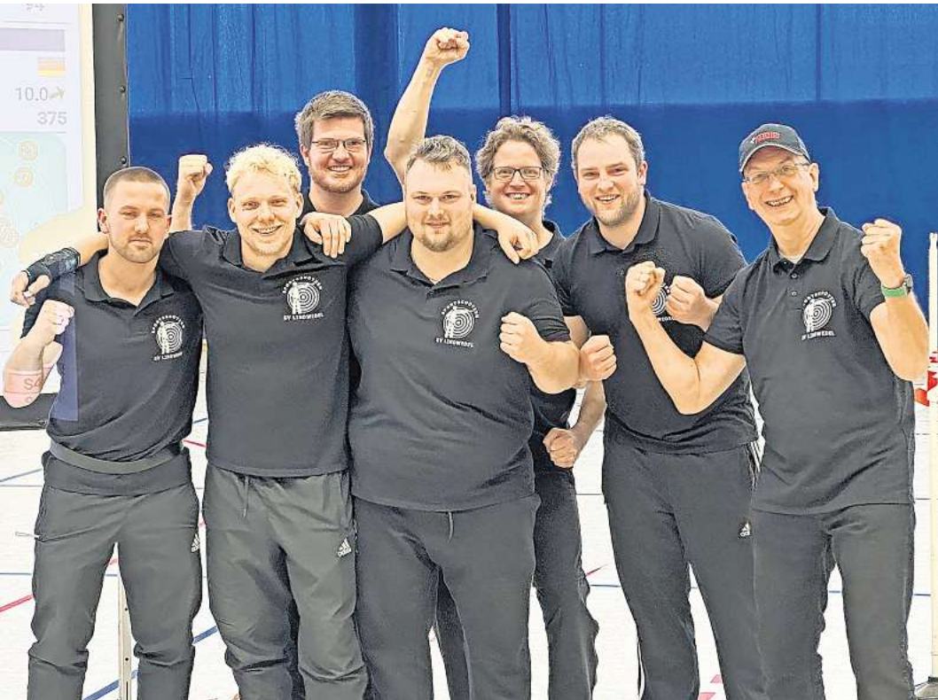
Das Fazit fürs Wochenende fiel für das Bundesliga-Team Luftpistole durchaus positiv aus.