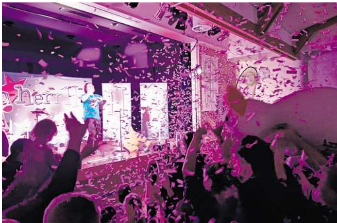
Schaffte eine einmalige Atmosphäre von Geborgenheit: HerrH.

Im Anschluss hatte jeder die Möglichkeit dem Star noch mal ganz nah zu sein und ein Highfive auszutauschen. Eine Autogrammkarte nebst persönlicher Widmung gab es selbstverständlich dazu. Am Ausgang konnte man nicht nur Kinderaugen leuchten sehen, auch die der Erwachsenen strahlten. Weitere Infos unter www.dorflebensgrindau.de