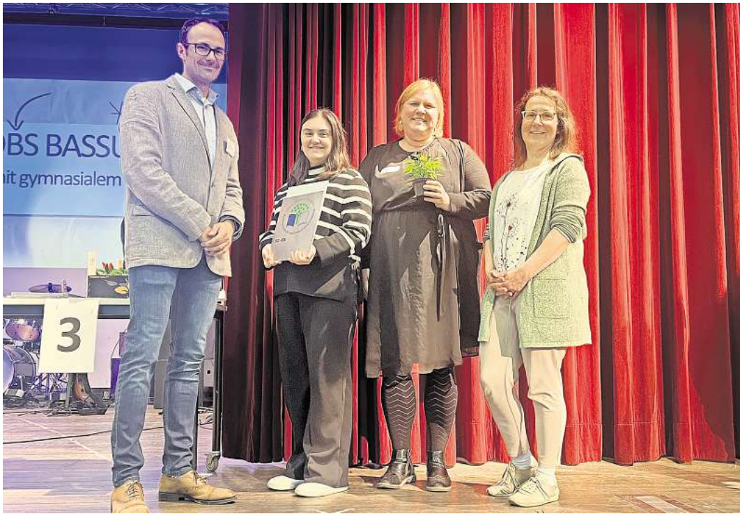
Die IGS Wedemark beeindruckte mit ihren innovativen Ideen.

Durch die Präsenz an schulischen Veranstaltungen (zum Beispiel Schulfest, Tag der offenen Tür) hat sich die Schülerfirma mit ihrem eigens entwickelten Verkaufswagen präsentiert. Zusätzlich gibt es in den Mittagspausen