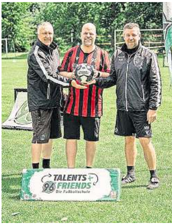
Knapp 60 Kids trainierten in der Fußballschule.

SCHWARMSTEDT. Lang ersehnt und nun war es endlich so weit - am EM-Eröffnungswochenende fand die 96-Talents+Friends-Fußballschule beim SV Lindwedel-Hope e.V. statt. Drei Tage trainierten knapp 60 Kids unter professionellen Trainern von Hannover 96. Die fußballbegeisterten Bambinis gesellten sich am Samstag dazu und schlossen den Tag mit einem FUNino-Turnier ab, die großen Teilnehmer der 96-Talents+Friends-Fußballschule hatten am Sonntag ihr Abschlussturnier. Für herzhafte und süße Speisen sowie Getränke war das ganze Wochenende gesorgt. Auch die Tombola war wieder ein Highlight. Natürlich gab es auch in diesem Jahr die Verlosung der Hauptpreise. Der Erlös der Veranstaltung kommt ausschließlich der Jugend des SV Lindwedel-Hope zugute. Die symbolträchtige Ballübergabe zwischen Mi-