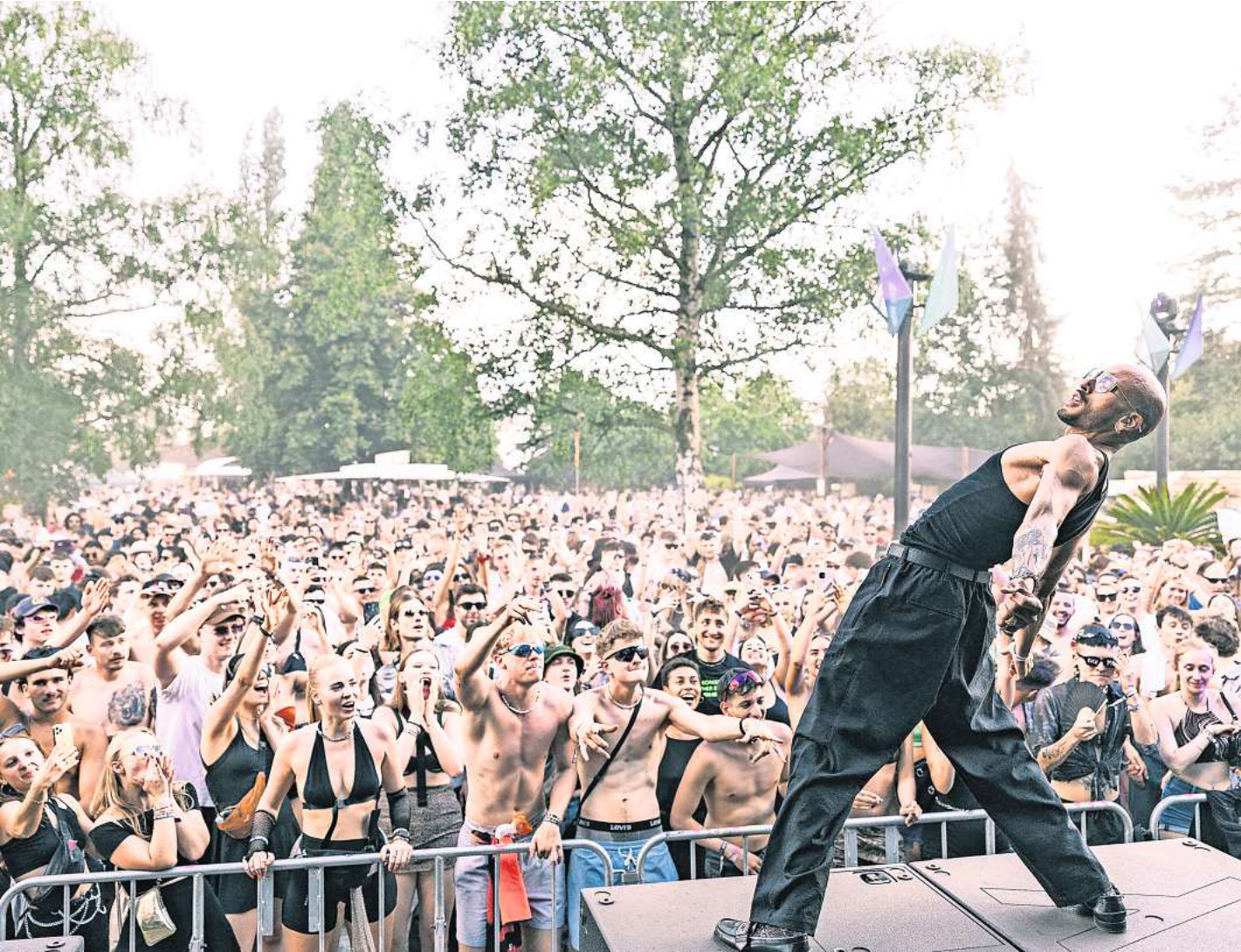
So war es 2023: Die Festival begeistert die Massen in Mellendorf.

Waves-Open-Air-Festival in Mellendorf geht in seine fünfte Auflage und wird noch größer