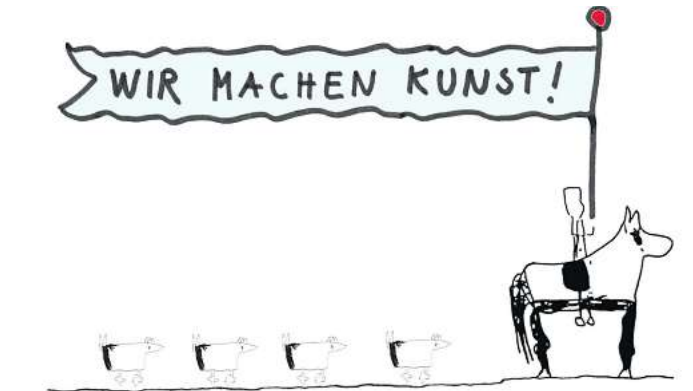
Wer mag, kann an der Kinder- und Jugendkunstschule Wedemark seiner Kreativität freien Lauf lassen.