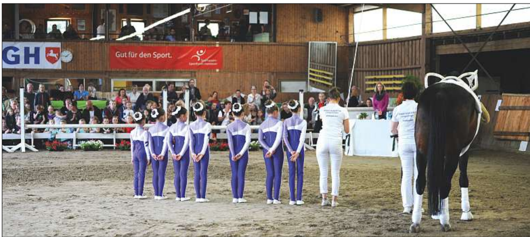
Volles Haus: Das Foto aus dem Jahr 2022 zeigt ein Voltigierturnier in der Reithalle.

Im Raum steht dabei die Frage, wann das Pachtverhältnis für die Reithalle endet. Fischer hatte dieses gekündigt, weil der Verein keine Versicherung für Leitungswasserschäden vorweisen konnte. Das