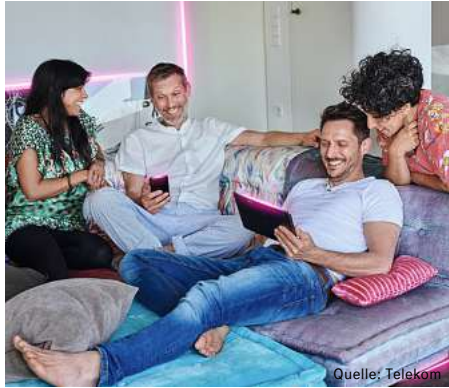
Für 7.000 Haushalte und Unternehmen baut die Telekom ihr Glasfaser-Netz aus.

Telekom verlegt Glasfaser – bis Ende 2023 kostenloser Hausanschluss