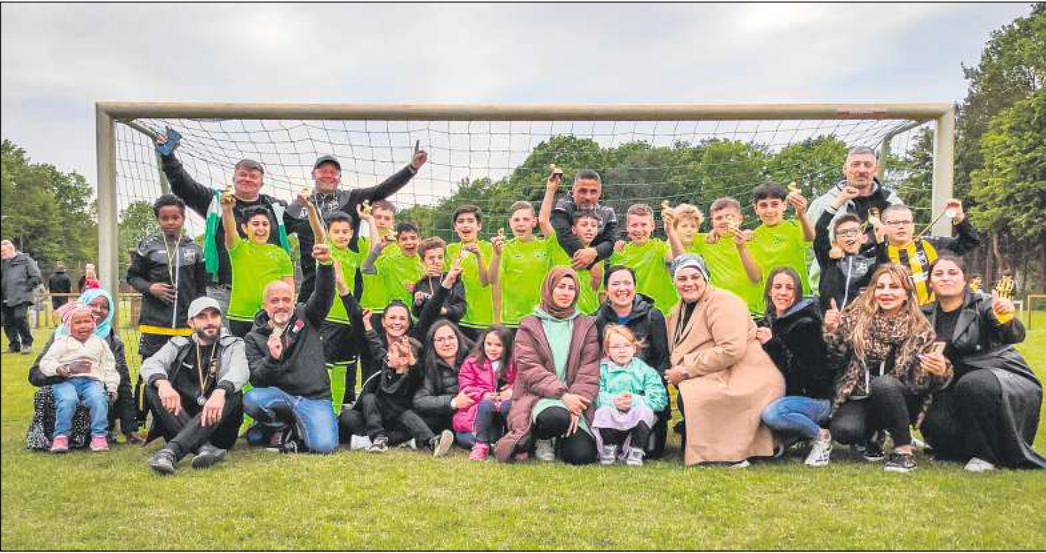
Kids und Eltern hatten auf der Anlage jede Menge Spaß.

Camp“. Nach dem gemeinsamen Grillen mit den Eltern wurde fleißig Stockbrot über dem Lagerfeuer gebacken. Anschließend ging es zur Nachtwanderung. Bei Dunkelheit wurde um 23 Uhr der Silbersee nach dem „Silbersee-Schatz“ abgesucht. Unterstützt wurden die Kleinen von den großen Fußball-Kids, sodass der Schatz geborgen werden konnte. Am nächsten Morgen fand die aufregende Zeit mit einem gemeinsamen Frühstück ein Ende. Doch auch im nächsten Jahr heißt es wieder „Sparta camp“.