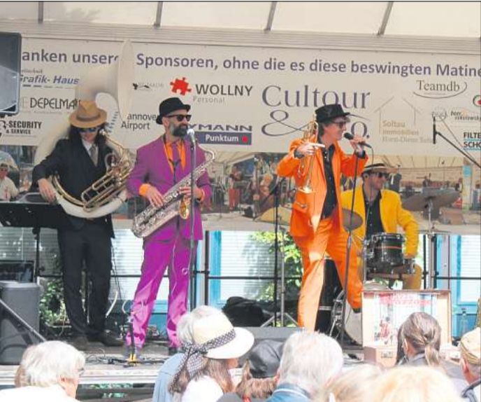
Längst kein Geheimtipp mehr: Brazzo Brazzone sorgen für gute Laune, hier bei der Jazzmatinee 2021.