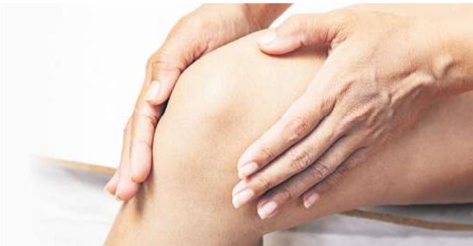
Auf dem Markt gibt es inzwischen ein ganz besonderes CBD Gel, das Menthol und Minzöl zur Pflege beanspruchter Muskeln enthält.