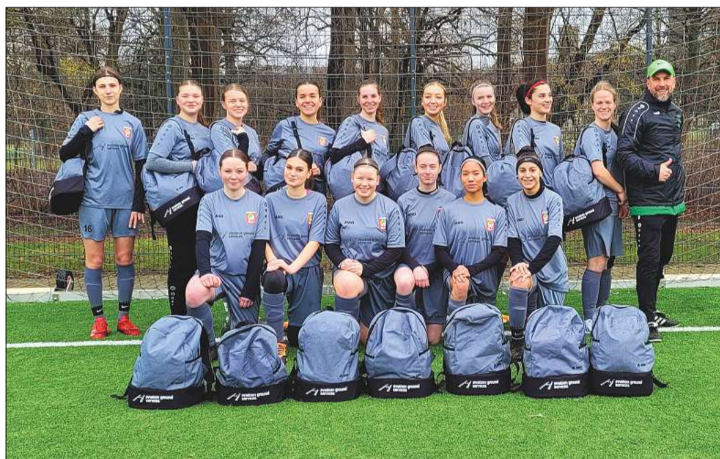
Die Godshornerinnen liegen aktuell als stärkstes Bezirksligateam in der Region Hannover auf Rang vier der Tabelle.

Die Vorbereitung auf die Rückrunde ist bereits in vollem Gange. Drei Testspiele auf dem Kunstrasen des Sportcampus Hannover konnten die Godshornerinnen bereits erfolgreich bestreiten. In der Bezirksliga Hannover/Braun-