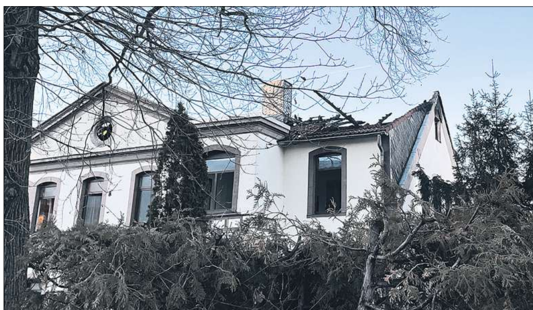
Der Dachstuhl des Wohnhauses in der Straße „Am Pferdemarkt“ ist nach dem Feuer teilweise ausgebrannt.

„Das war für die Kameradinnen und Kameraden eine ziemlich belastende Situation“, sagt Kley, „denn zu diesem Zeitpunkt galt eine Person noch als vermisst.“ Während der sogenannten Nachlöscharbeiten fanden sie dann eine Person leblos in der Dachgeschosswohnung. „Ob es sich dabei